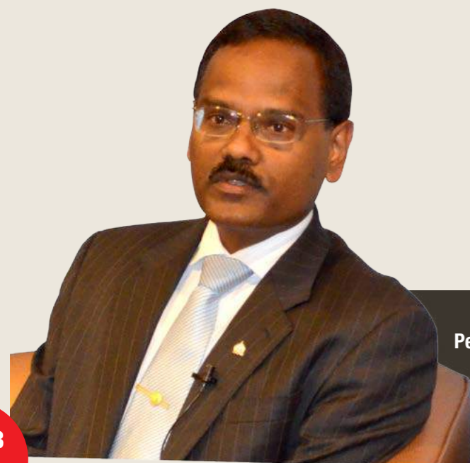
INTERPOL Penolong Pengarah Sub-Direktorat Pencegahan Rasuah Jaganathan Saravanasamy

"Kami dapat mengetahui masalah yang dihadapi oleh agensi-agensi terbabit dalam pentadbiran mereka sendiri samada dalam lingkungan penguatkuasaan mereka ataupun siasatan yang melangkaui sempadan. Kemudiannya INTERPOL akan mencadangkan penyelesaian yang boleh diguna pakai," tambah beliau.