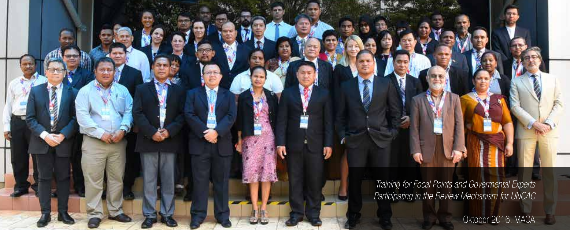
Training for Focal Points and Governmental Experts Participating in the Review Mechanism for UNCAC

United Nations Office on Drugs and Crime