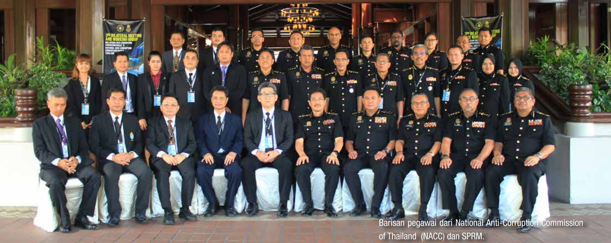
Barisan pegawai dari National Anti-Corruption Commission of Thailand (NACC) dan SPRM.