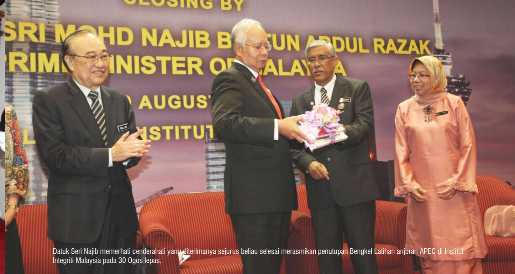
Datuk Seri Najib memerhati cenderahati yang diterimanya sejeurus beliau selesai merasmikan penutupan Bengkel Latihan anjuran APEC di Institut Integriti Malaysia pada 30 Ogos lepas.

BULETIN SURUHANJAYA PENCEGAHAN RASUAH MALAYSIA