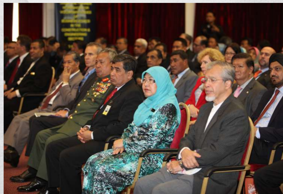
Antara tetamu yang hadir di Majlis Penutup Bengkel APEC yang dirasmikan oleh Datuk Seri Najib di Institut Integriti Malaysia (IIM).