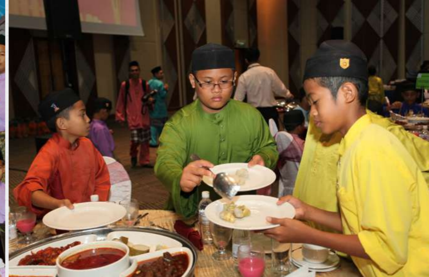
Tetamu Khas... Sebahagian anak yatim yang diraikan di Majlis Mesra Rangkaian SPRM.