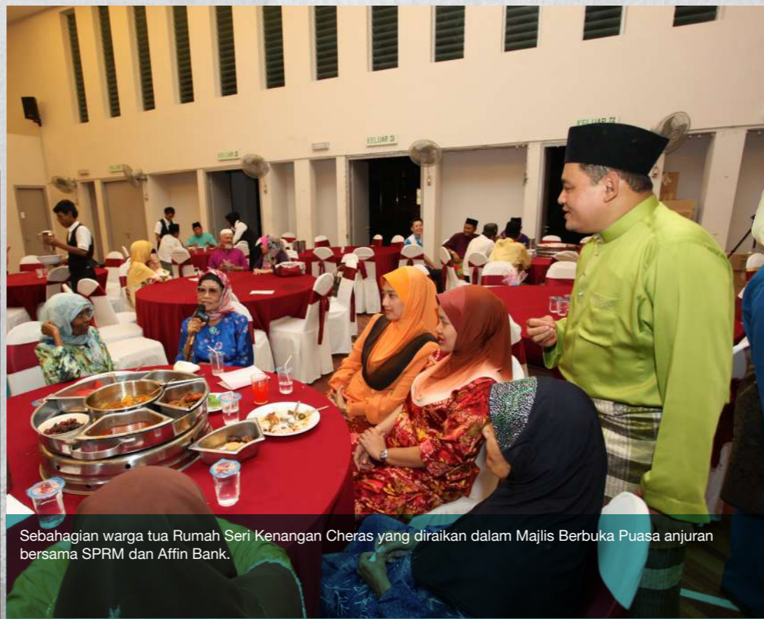
Sebahagian warga tua Rumah Seri Kenangan Cheras yang diraikan dalam Majlis Berbuka Puasa anjuran bersama SPRM dan Affin Bank.