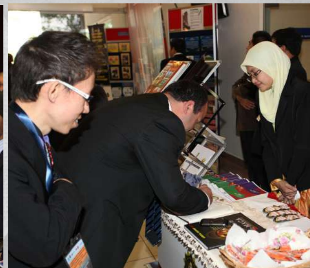
Pameran SPRM sempena Bengkel APEC di Institut Integriti Malaysia (IIM).