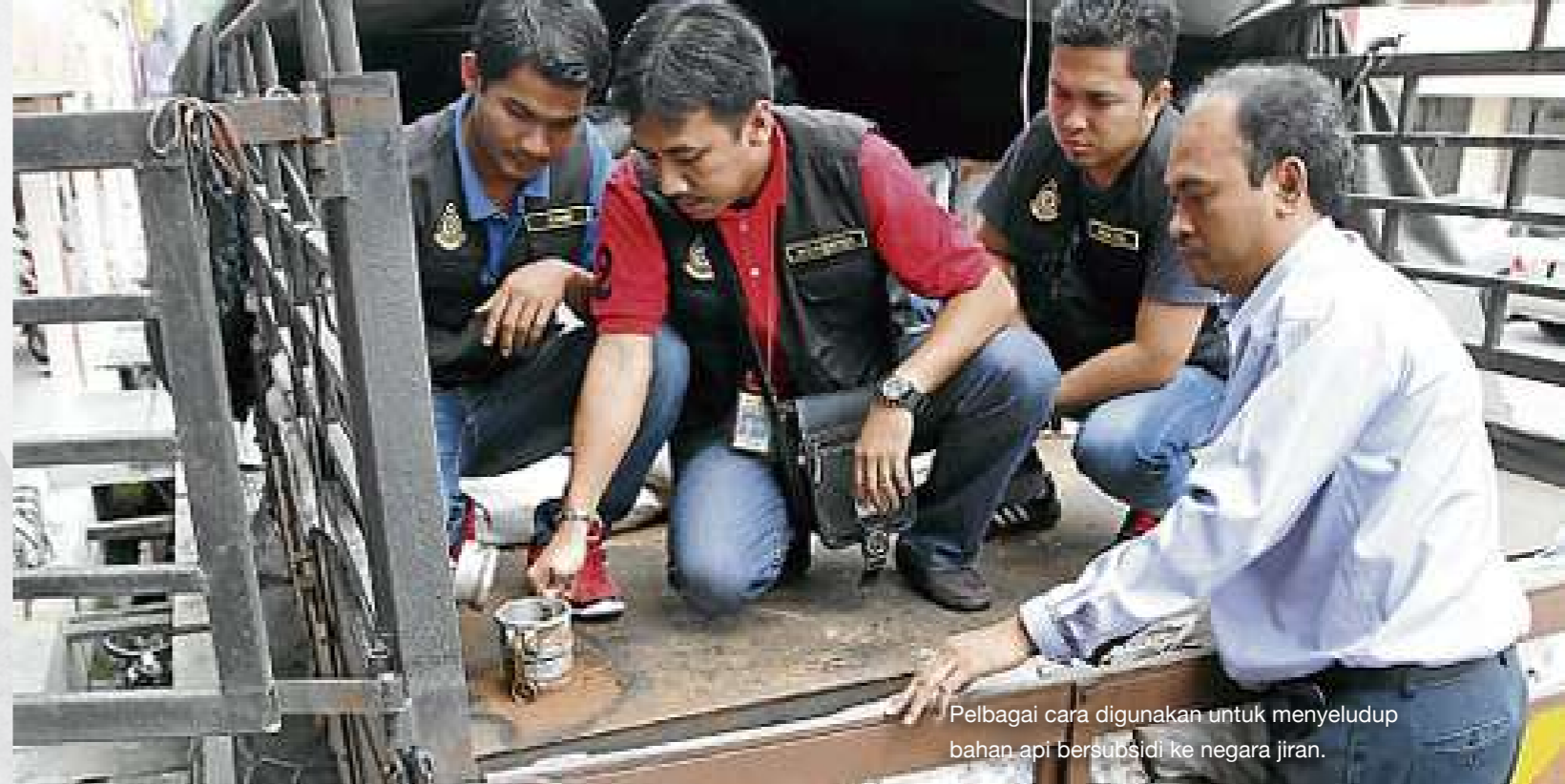
Pelbagai cara digunakan untuk menyeludup bahan api bersubsidi ke negara jiran.