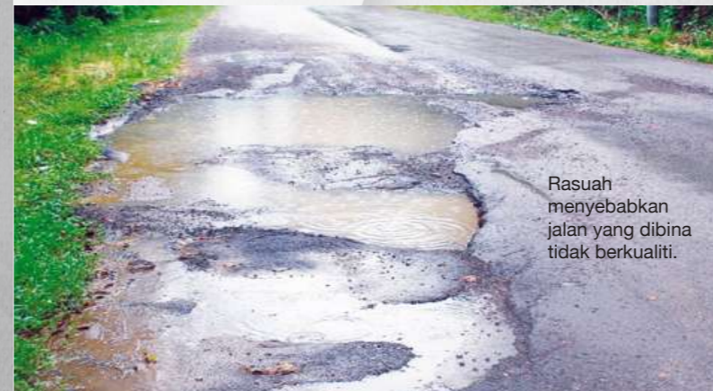
Rasuah menyebabkan jalan yang dibina tidak berkualiti.

Katanya, kerajaan bercadang menubuhkan taskforce anti rasuah dalam sektor pembinaan yang dianggap berisiko tinggi dengan jumlah nilai projek pembinaan kerajaan dan swasta dianggarkan melebihi RM 80 bilion sejak tahun 2007.