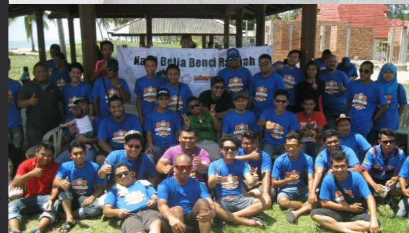
Sebahagian peserta Keicarmania berkumpul di hadapan banner "Kami benci rasuah" sebagai tanda sokongan kepada SPRM

Walaupun diadakan secara santai, program selama tiga hari ini (24 hingga 26 Mei 2013) menampakkan kesedaran masyarakat mengenai rasuah. Malah ketika sesi soal jawab diadakan pada hari kedua, pelbagai kemusyikilan mengenai rasuah diutarakan ahli-ahli kelab mahupun tetamu yang hadir. Sebagai tanda sokongan kepada SPRM, ahli-ahli kelab menurunkan tandatangan pada kain rentang (banner) yang berslogan "Kami Benci Rasuah". Kain rentang tersebut digantung pada pintu masuk resort untuk tatapan orang ramai. Ia juga menjadi acara penutup bagi kembara ahli-ahli kelab ini.