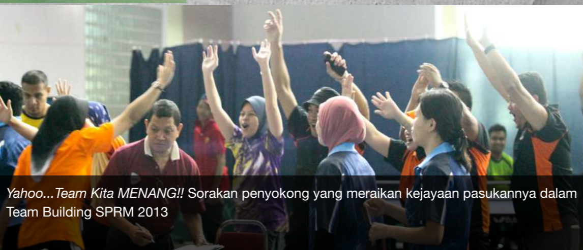
Yahoo... Team Kita MENANG!! Sorakan penyokong yang meraikan kejayaan pasukannya dalam Team Building SPRM 2013