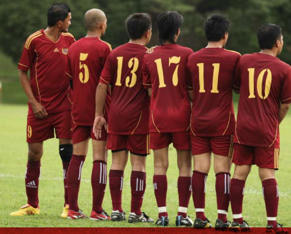
Ini baru betul Team Building...