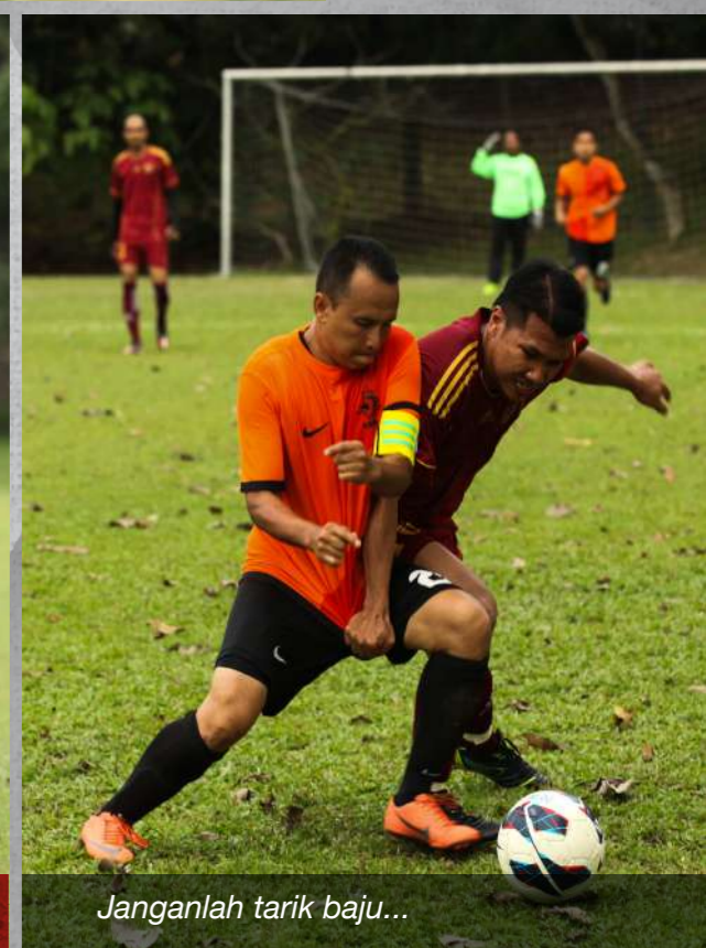
Janganlah tarik baju...