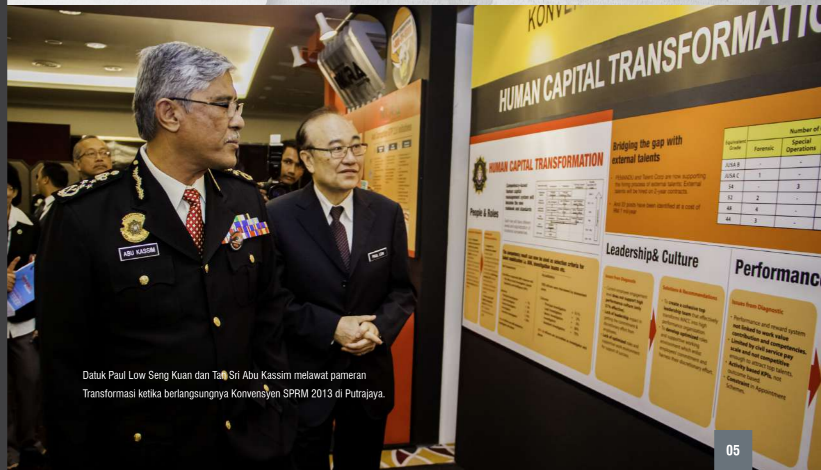
Datuk Paul Low Seng Kuan dan Tan Sri Abu Kassim melawat pameran Transformasi ketika berlangsungnya Konvensyen SPRM 2013 di Putrajaya.

Setakat ini, transformasi pencegahan masih lagi berada dalam fasa pertama. Prosesnya akan berlarutan sehingga penghujung Mac 2014. Semua warga SPRM mesti terlibat dengan transformasi yang sedang dilaksanakan ini. Bermula dengan perubahan diri baik dari segi minda mahupun semangat sebagai sokongan padu demi memastikan matlamat transformasi SPRM tercapai.