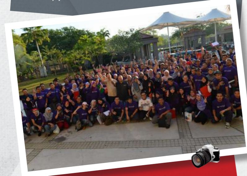
Bersemangat !! Peserta -peserta Treasure Hunt Piala TKSU Kanan Jabatan Perdana Menteri bergambar kenangan sebelum pertandingan bermula