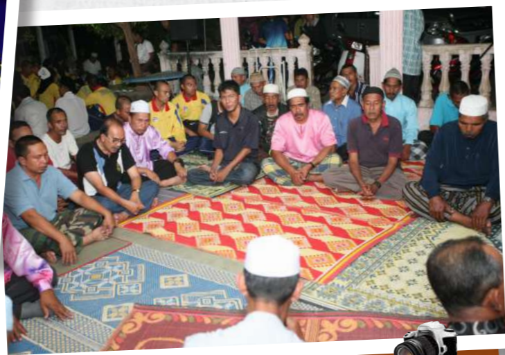
Bersama Masyarakat .... Pegawai SPRM tidak melepaskan peluang dalam bersama-sama mendekati penduduk kampung di dalam program kemasyarakatan di Kampung Luat, Lenggong Perak