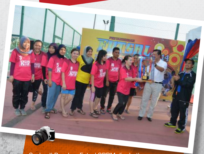
Syabas!! Pasukan Futsal SPRM dinobatkan sebagai juara kategori wanita pada Kejohanan Futsal Piala Ketua Setiausaha Negara (KSN) 2014