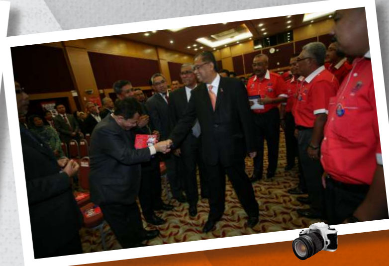
Dato' Seri Ismail Sabri Yaakob beramah mesra dengan hadirin di Seminar Integriti Keutuhan Tadbir Urus dan Majlis Menandatangani Ikrar Integriti Korporat (CIP) TEKUN Bersama SPRM