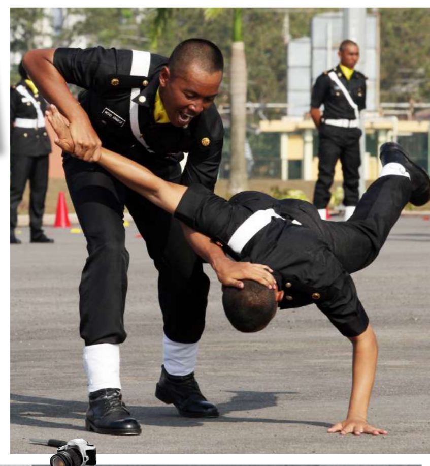
Tangkas!! pelatih kadet sedang menunjukkan aksi seni mempertahankan diri sempena Majlis Perbarisan Tamat Latihan Kursus Asas Pegawai SPRM Siri 13 Bil. 1/2013 (P29) di Padang Kawat SPRM Johor Bharu