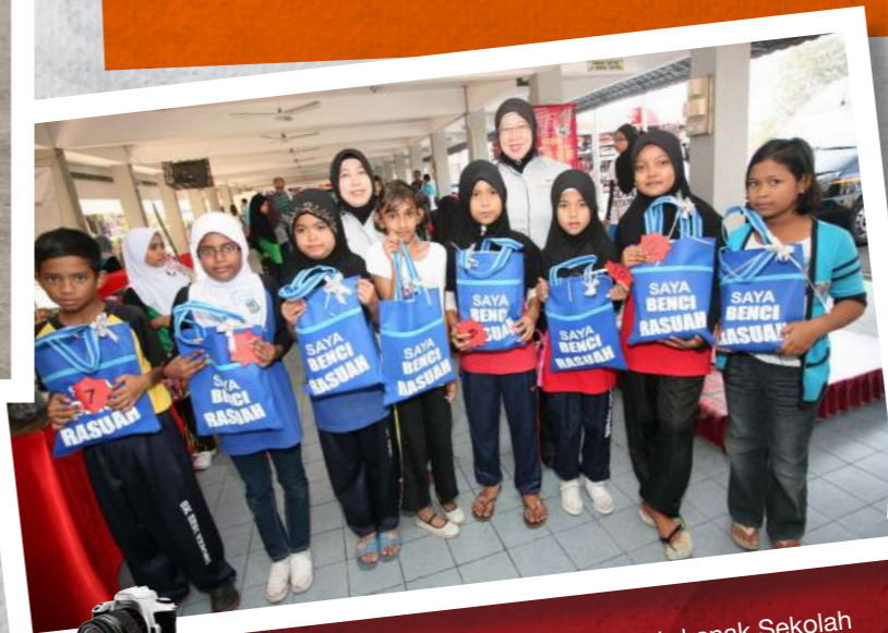
"Melentur Buluh Biar dari Rebungnya" ... Kanak-kanak Sekolah bergambar kenangan bersama bahan kempen masing-masing dan petugas pameran dari Bahagian Pendidikan Masyarakat SPRM sempena Hari Karnival SK Sri Kepong 1 Kuala Lumpur