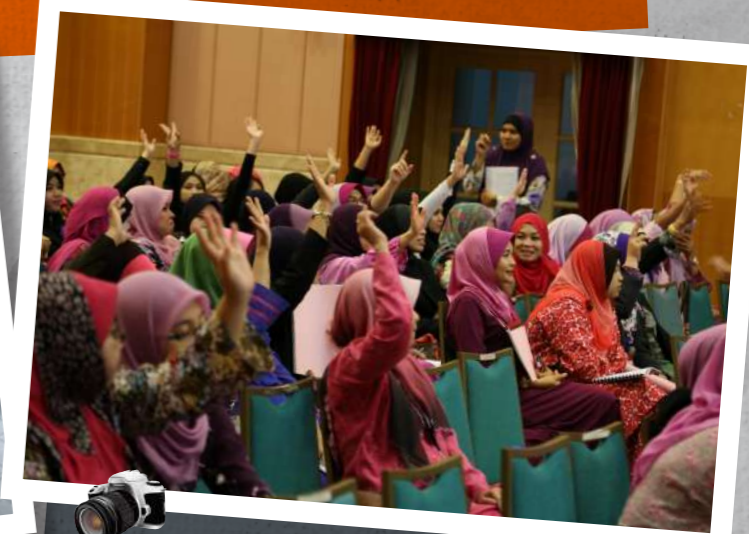
Kami sokong!! ..reaksi ahli Puspanita SPRM semasa sesi pemilihan AJK sempena Mesyuarat Terhimpun Puspanita SPRM kali ke 12