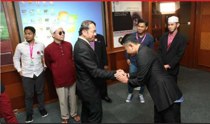
Lawatan peserta-peserta program Pencetus Ummah (PU) ke ibu pejabat SPRM pada 13 November 2015.