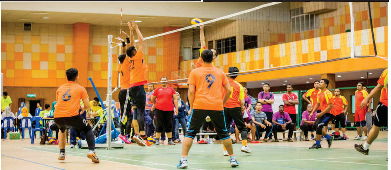
Antara yang mendapat perhatian dalam acara team building SPRM 2015, perlawanan bola tampar lelaki.