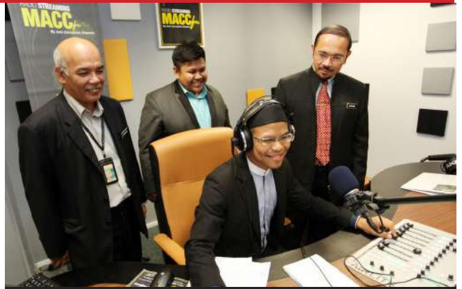
macc.fm memulakan siaran secara rasmi pada 9 Disember 2015.