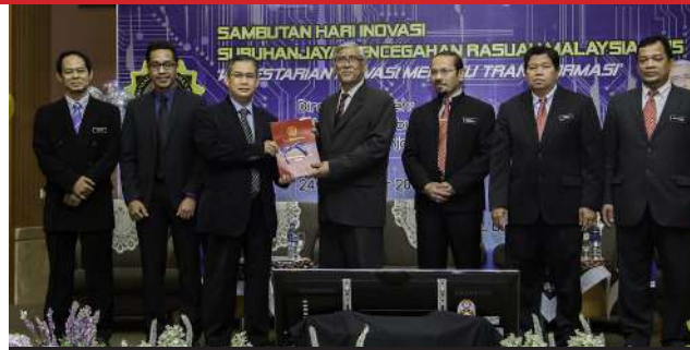
Penyerahan sijil Penghargaan oleh Ketua Pesuruhjaya SPRM kepada Pengarah Bahagian Rekod dan Teknologi Maklumat semasa Hari Inovasi SPRM.