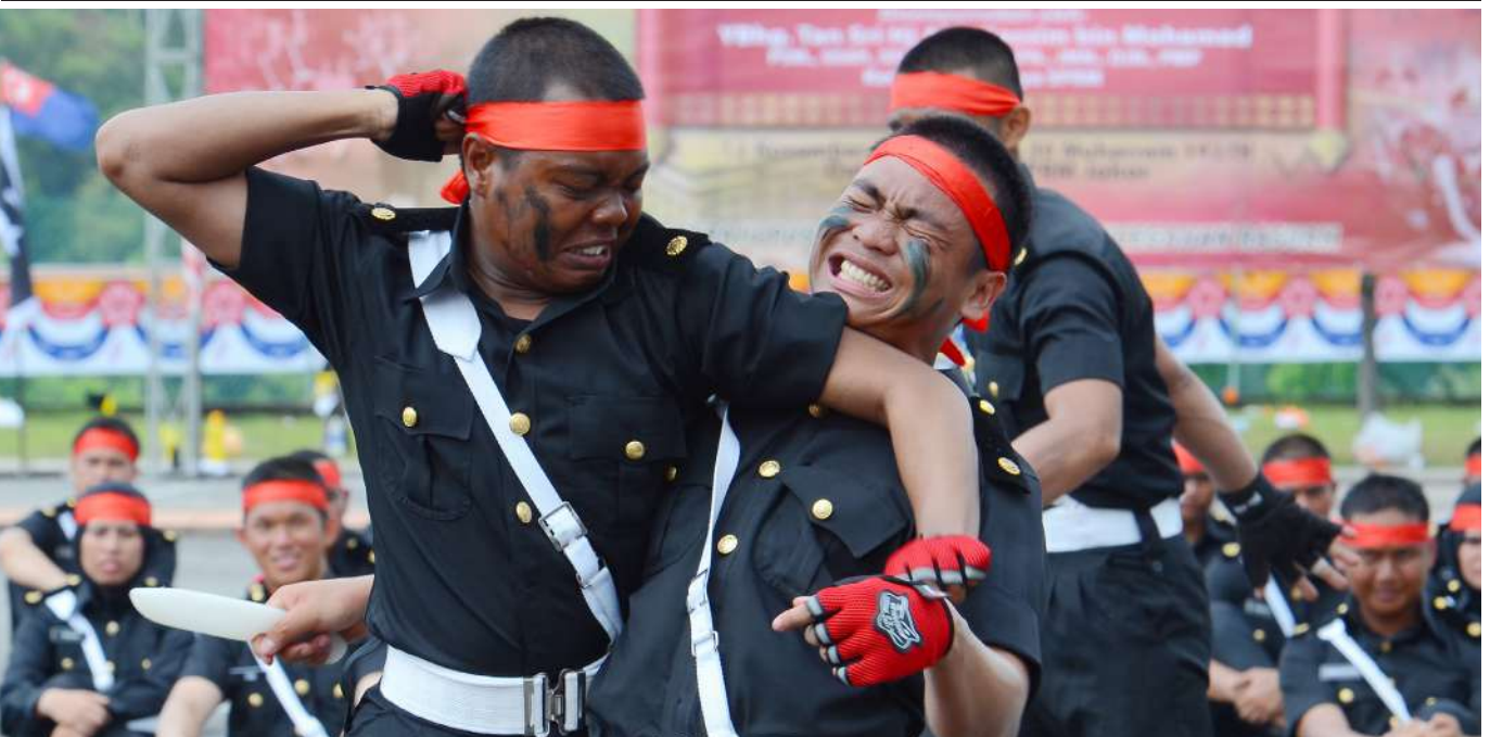
Majlis Tamat Latihan - Seni mempertahankan diri antara yang dipelajari oleh kadet dalam Kursus Asas Pegawai SPRM.