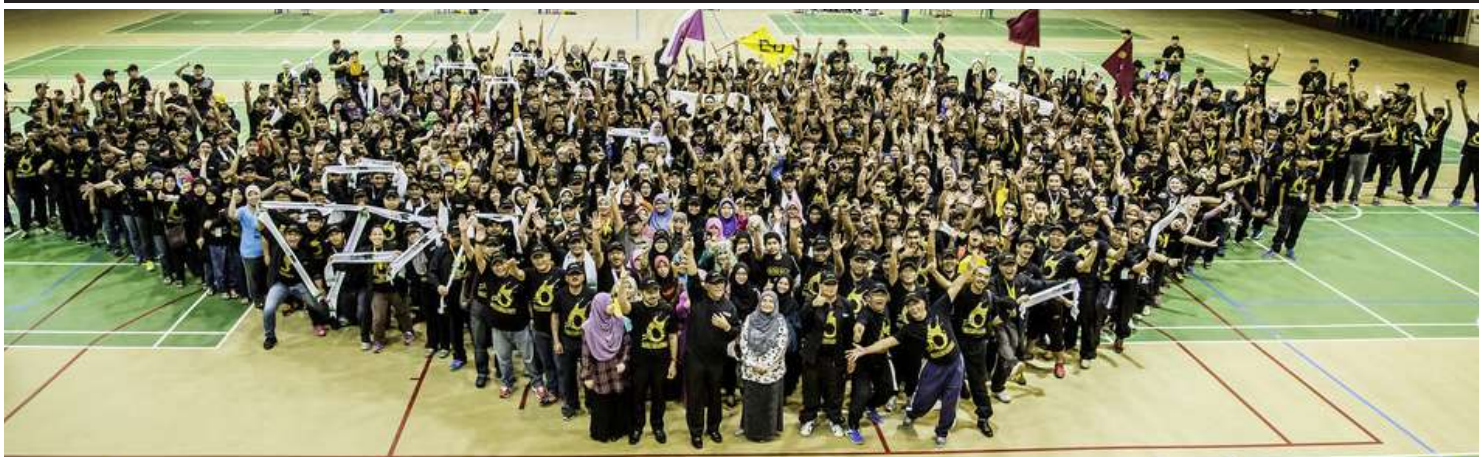
Kesepakatan, jalinan perpaduan dan semangat cintakan organisasi berjaya dipupuk dalam Konvensyen SPRM 2015 di Gambang, Pahang.