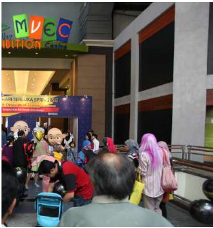
ngunjungi program Hari Terbuka Pameran Mid Valley.