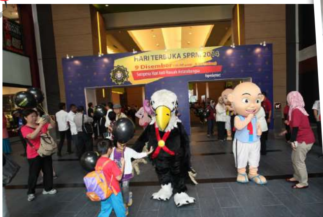
Maskot Upin, Ipin dan Agen Lang menjadi daya tarikan pengunjung terutama golongan kanak-kanak.