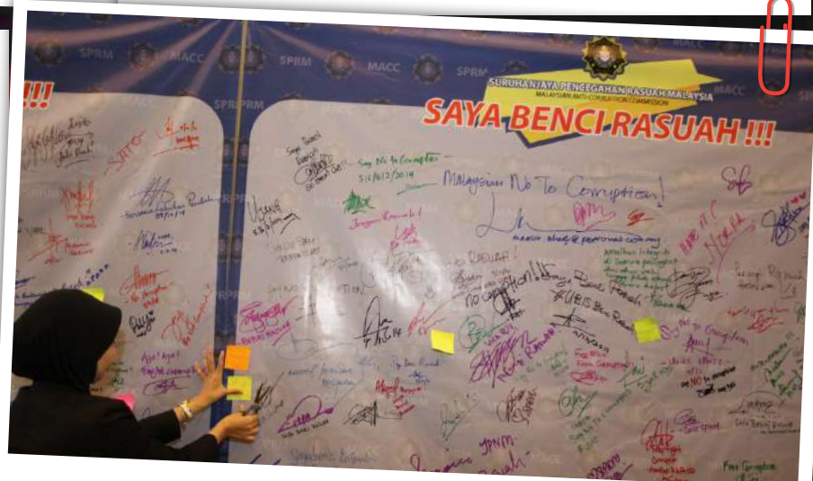
Tandatangan orang awam sebagai sokongan kepada SPRM untuk terus membanteras rasuah.