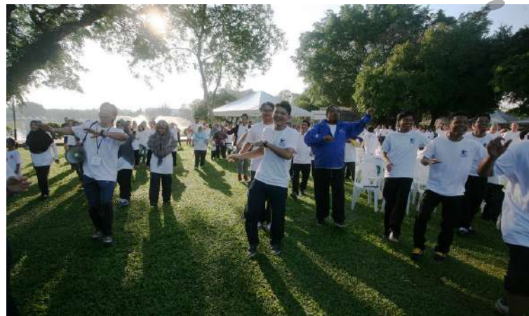
Senamrobik sebagai pemanas badan sebelum acara Walk Against Corruption' bermula.