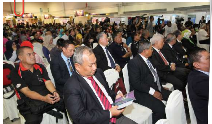
Dianggarkan lebih kurang 800 peserta hadir ke Forum Anti Rasuah semasa Hari Terbuka SPRM pada 9 Disember 2014.