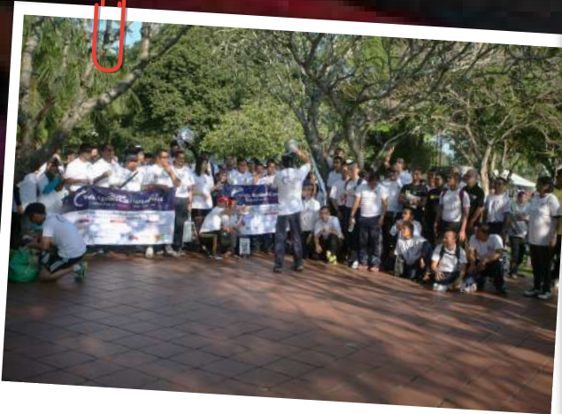
Para peserta diberi taklimat sebelum acara Walks Against Corruption bermula.