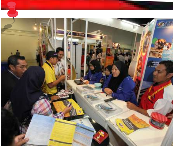
Pegawai-pegawai MACA memberi penerangan kepada pengunjung booth pameran mereka.