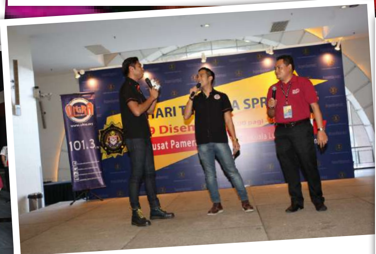
DJ-DJ Ultra FM memeriahkan Hari Terbuka SPRM 2014.