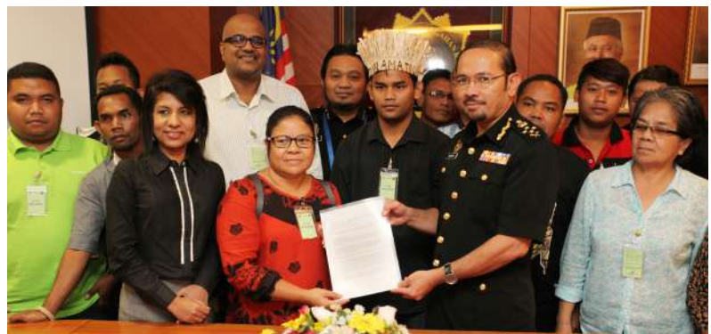
Dialog TKP (Pencegahan) SPRM Bersama Komuniti Orang Asli pada 26 Oktober 2015 di ibu pejabat SPRM.