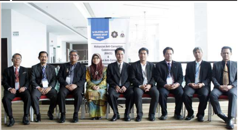
Mesuarat Bilateral dan Working Group pertama antara SPRM dan National Anti-Corruption Commission (NACC), Thailand pada 22-23 Oktober 2015 di Alor Setar, Kedah