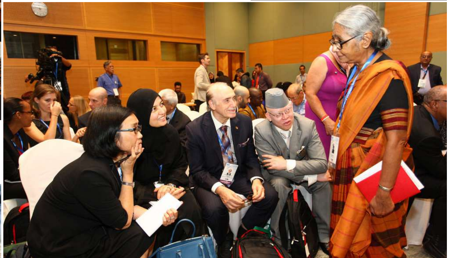
IACC Ke-16 menerima penyertaan lebih kurang 1,200 peserta dari 130 buah negara.