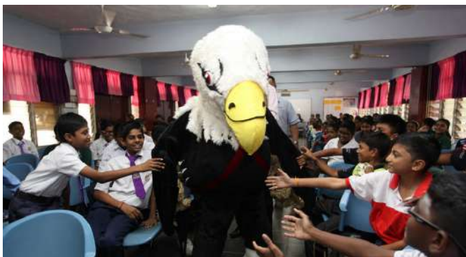
Para pelajar tidak melepaskan peluang bersalam dengan Ejen Lang yang merupakan maskot bagi program WAR.