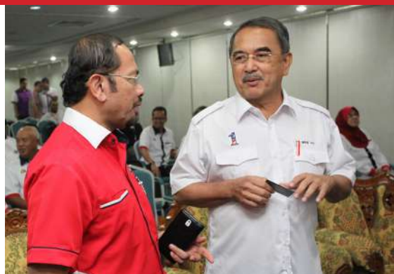
Mantan Ketua Menteri Melaka, Tan Sri Mohd Ali bin Mohd Rustam turut menyertai kolokium yang julung-julung kali diadakan oleh Kerajaan Negeri Melaka.