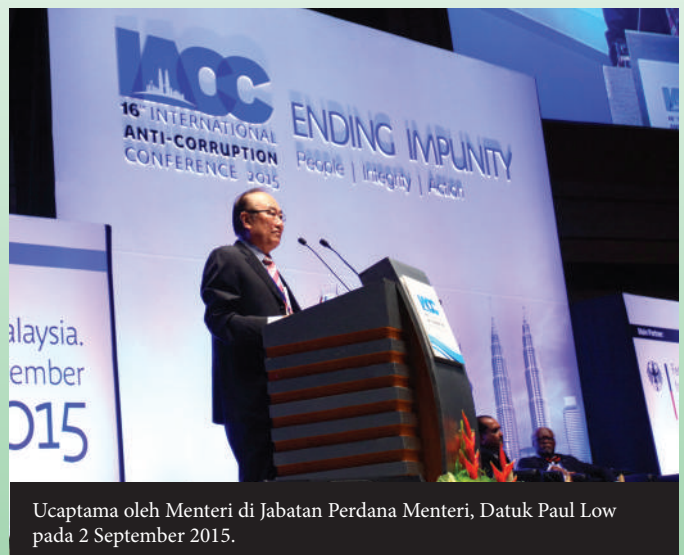
Ucuptama oleh Menteri di Jabatan Perdana Menteri, Datuk Paul Low pada 2 September 2015.

IACC Ke-16 mengeluarkan ‘Deklarasi Putrajaya’ sempena persidangan kali ini. 🌀