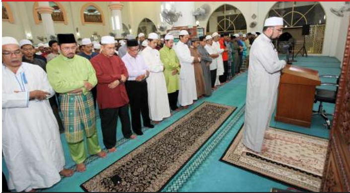
Program Bacaan Yasin dan Solat Hajat Perdana Sempena Ulang Tahun BPR/SPRM ke-48 di Kolej Universiti Islam Selangor (KUIS) pada 1 Oktober 2015.