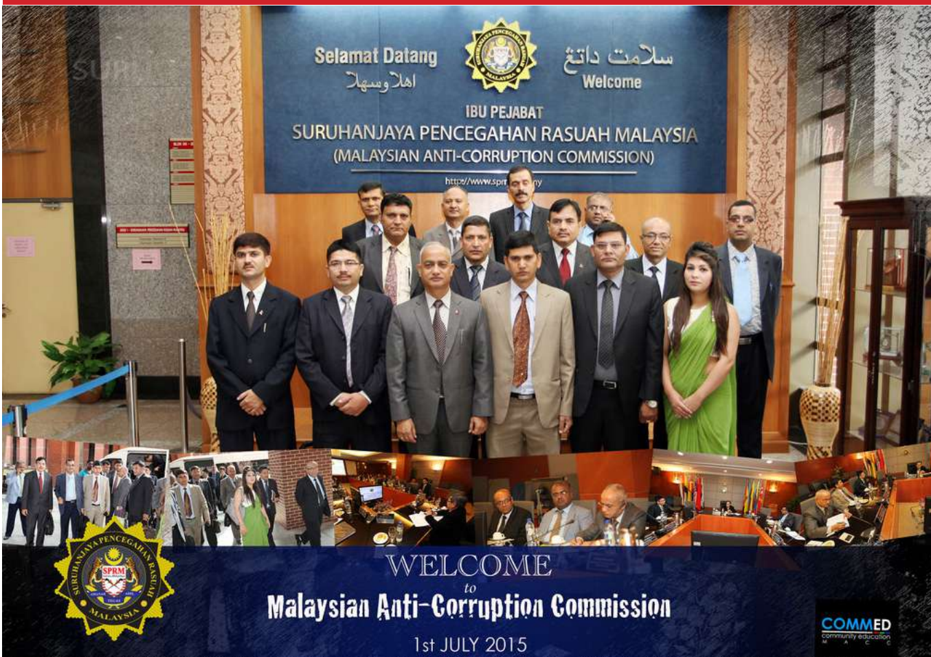
Lawatan Kerja daripada Delegasi Commission for the Investigation of Abuse of Authority (CIAA), Nepal.