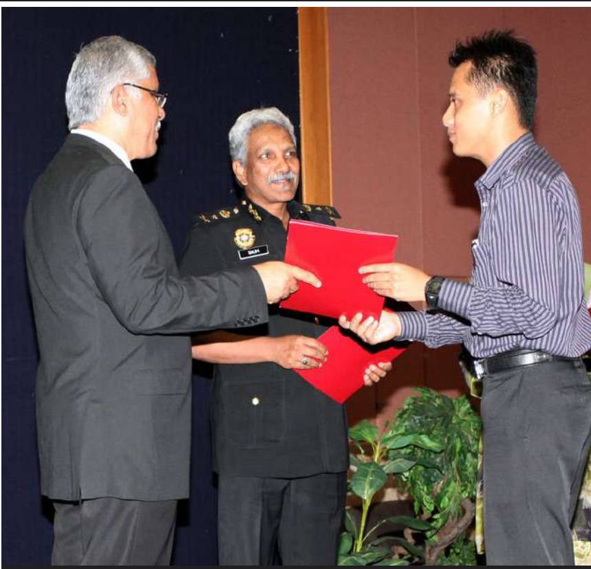
Antara penerima Sijil Penghargaan pada Sesi Sembang Santai Bersama Pengurusan Tertinggi sebagai tanda penghargaan kepada pegawai dan kakitangan yang sudi menderma darah.