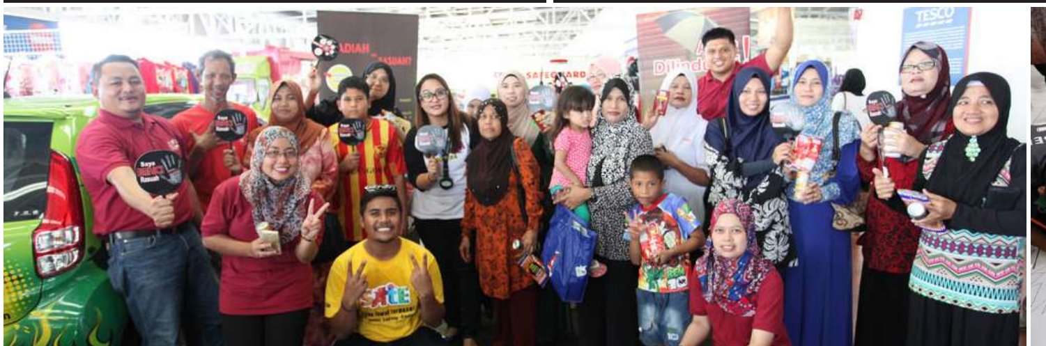
Gandingan Skwad Didik SPRM dan Skwad Perodua Era sekali lagi berkolaborasi mengadakan jelajah ke negeri Pulau Pinang dalam usaha menyebarkan informasi berkaitan rasuah.