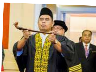
Permulaan Majlis Konvokesyen disempurnakan dengan perarakan barisan CeIO.