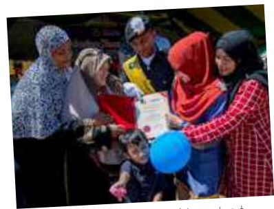
Kejayaan dan kegembiraan turut dikongsi bersama ahli keluarga.