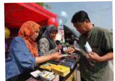
"Walk About SPRM" - warga SPRM bersemuka dengan masyarakat Pendang di UTC Alor Setar dan Pasar Pagi Pendang.