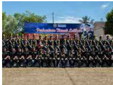
Barisan Pegawai SPRM bagi tahun 2016 bersama Pengurusan Tinggi SPRM