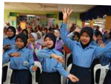
"Saya suka Integriti, Benci Rasuah" SK Guar Kepayang bergema.