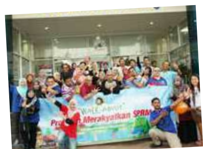
"SPRM bersama Kuantan" - Walk About SPRM beraksi di UTC Kuantan dalam menyebarkan pesanan pencegahan rasuah!