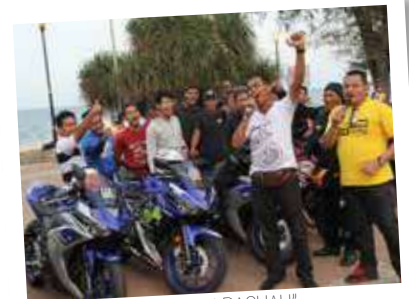
"Kami benci RASUAH", laungan sokongan padu daripada kumpulan 'bikers' yang handal.