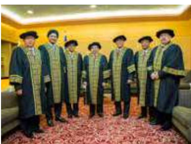
Barisan ahli Lembaga Pengiktirafan Pegawai Integriti Bertauliah