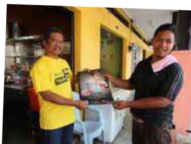
"Walk About SPRM" - warga SPRM bersemuka dengan masyarakat Pendang di UTC Alor Setar dan Pasar Pagi Pendang.