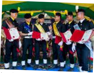
Kumpulan para pelatih terbaik megah dan bangga dengan anugerah yang diterima.