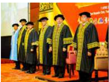
Majlis Konvokesyen CeLO dijalankan dengan penuh disaksikan oleh dif-dif kehormat.