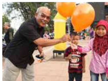
Pengarah Bahagian Pendidikan Masyarakat SPRM, mesra berinteraksi dengan warga muda Kuantan.