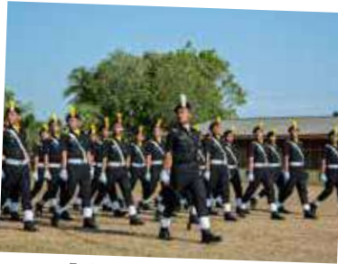
Perbarisan oleh kadet SPRM yang bakal meneruskan misi mencegah rasuah