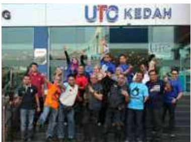
"Walk About SPRM" - warga SPRM bersemuka dengan masyarakat Pendang di UTC Alor Setar dan Pasar Pagi Pendang.