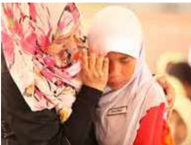
Ceramah Integriti menyentuh hati murid-murid SK Guar Kepayang.