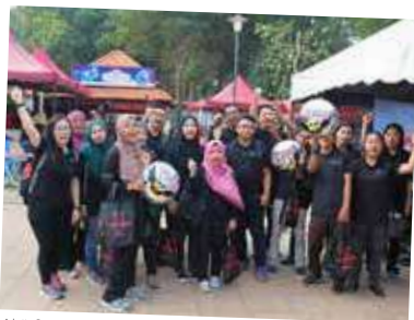
Ahli Sekretariat Pencegahan Rasuah Universiti Malaysia Pahang turut terlibat dalam menyebarkan usaha pencegahan rasuah.