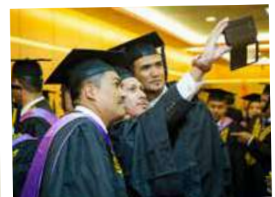
Meraikan kejayaan, setelah ditauliahkan sebagai CeLO