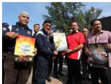
Pahang Bikers bersama SPRM sebagai Key Communicator menyebarkan pesanan anti-rasuah.