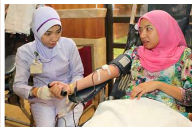
"Menderma darah semulia-mulia sedekah"