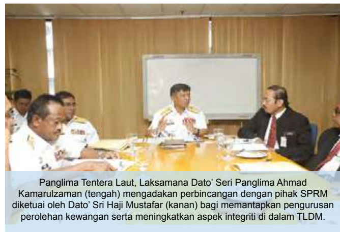
Panglima Tentera Laut, Laksamana Dato' Seri Panglima Ahmad Kamarulzaman (tengah) mengadakan perbincangan dengan pihak SPRM diketuai oleh Dato' Sri Haji Mustafar (kanan) bagi memantapkan pengurusan perolehan kewangan serta meningkatkan aspek integriti di dalam TLDM.

Yang pertama adalah melaksanakan proses konsolidasi semua kontraktor, syarikat pembekal dan perkhidmatan yang berdaftar dengan TLDM bagi mengenal pasti syarikat yang benar-benar tulen, berkeupayaan serta komited untuk menyokong usaha menentukan kesiapsiagaan aset TLDM dibuat secara telus, berintegriti dan menjaga kepentingan TLDM dan kerajaan terpelihara.