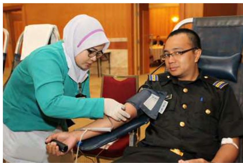
"Setitik darah sejuta rasa"