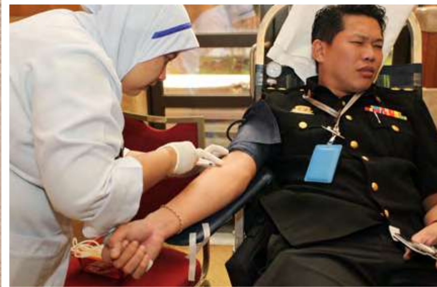
"Derma darah, selamatkan nyawa"