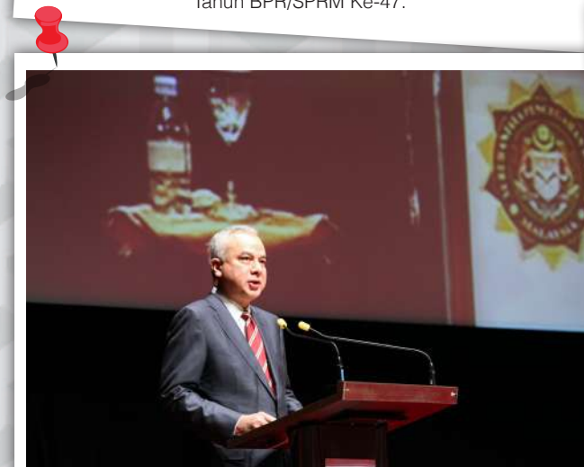
Titah DYMM Sultan Nazrin sarat dengan iktibar, nasihat, saranan dan teguran untuk kebaikan SPRM dan negara amnya.