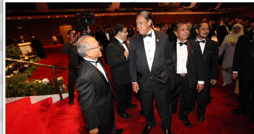
Dato' Sri Ahmad Said bin Hamdan (Mantan Ketua Pesuruhjaya SPRM) beramah mesra dengan pegawai SPRM di Majlis Makan Malam sempena ulang tahun penubuhan BPR/SPRM.