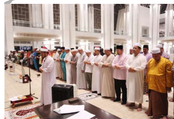
Solat Hajat yang diimamkan oleh Imam Masjid Sultan Mizan Zainal Abidin memohon kesejahteraan dan kecemerlangan SPRM yang berterusan.