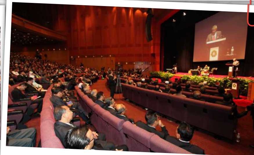
Hadirin yang terdiri daripada sektor awam, swasta, NGO dan politik tekun mendengar Titah Diraja bertajuk 'Rasuah: Senario dan Cabaran'.