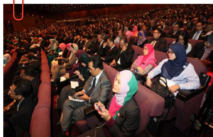
Hadirin tekun mendengar Titah Diraja yang disampaikan oleh DYMM Sultan Nazrin.