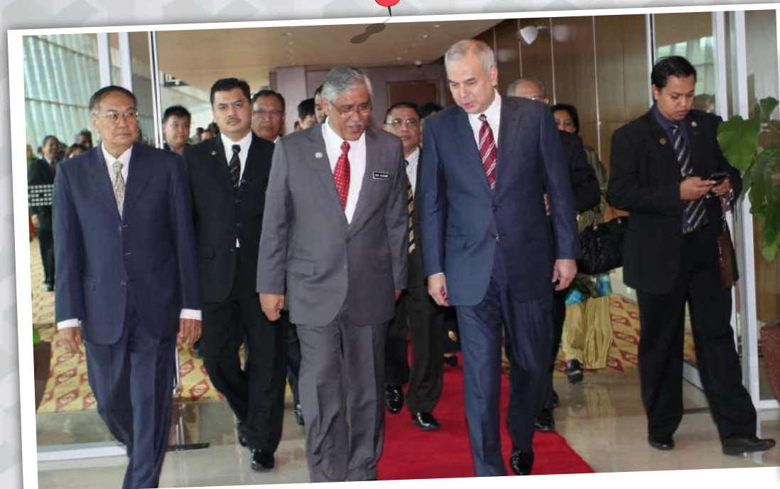
Keberangkatan tiba DYMM Sultan Nazrin.