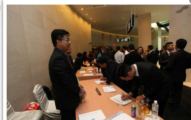
Sesi pendaftaran bagi hadirin Majlis di Hati Rakyat