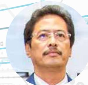
TIMBALAN KETUA PESURUHJAYA (OPERASI) TKPJ DATUK SERI AZAM BIN BAKI